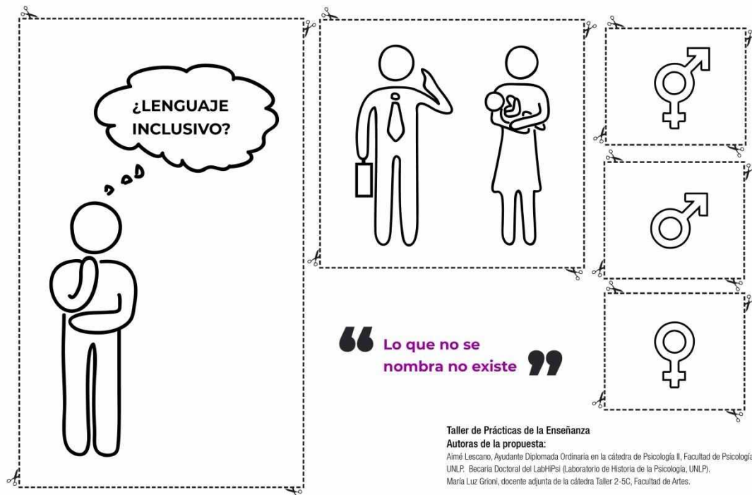
Figura 2: Materiales elaborados para el momento expositivo que serán retomados para el armado de infografías en el tercer momento de taller. Estos materiales fueron diseñados específicamente para la presente propuesta.